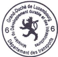
Marco FELTES Inspecteur Principal 1 er en rang

Pour le Ministre du Développement durable et des Infrastructures